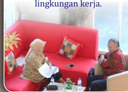
Employee Assistance Program (EAP)

Layanan dukungan psikologis bagi karyawan guna menjaga kesehatan mental di lingkungan kerja.